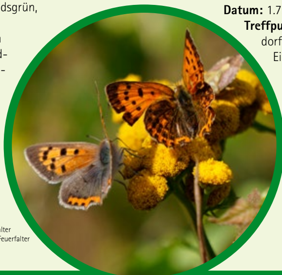
Kleiner Feuerfalter und Dukaten-Feuerfalter R.Lützkendorf

Datum: 18.6.22, 10:00 bis 14:00, VHS-Kurs 22AH100112, Leitung Joachim Blachnik Treffpunkt: Bürgerscheune Geroldgrün, Keyßerstraße 46 Mitbringen: Smartphone mit den Apps „Flora Incognita“ und „Feldbotanik- Artentrainer“, Pflanzenführer (z.B. KOSMOS, Rothmaler), wettergerechte Kleidung, Sonnenschutz, Verpflegung, Picknickdecke Gebühr: 20 €, Anmeldung bis 11.6. bei VHS Hofer Land, 09281 7145-0, info@vhshoferland.de, www.vhshoferland.de