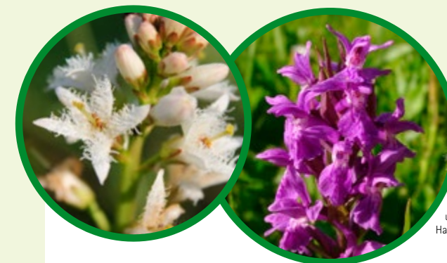
Fieberklee und Knabenkraut, Hartmut Endress

Bund für Umwelt und Naturschutz Deutschland