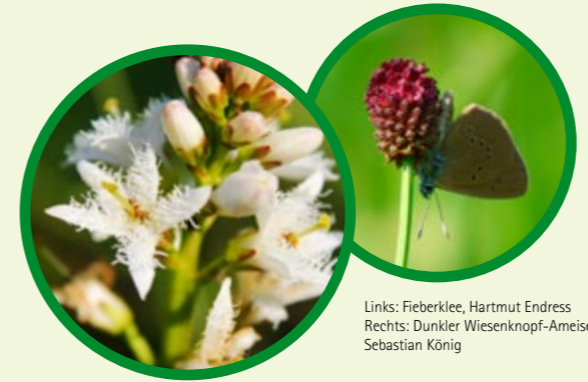
Links: Fieberklee, Hartmut Endress Rechts: Dunkler Wiesenknopf-Ameisenbläuling, Sebastian König

Bund für Umwelt und Naturschutz Deutschland