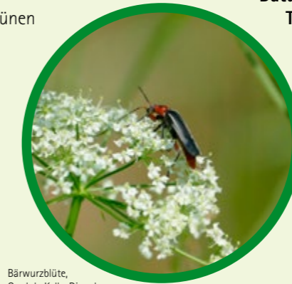
Bärwurzbüte, Cordula Kelle-Dingel

Veranstalter: Ökologische Bildungsstätte Oberfranken e.V., Anmeldung bis zum 19.6.2023 unter 09266 – 8252 oder info@oebo-natur.de