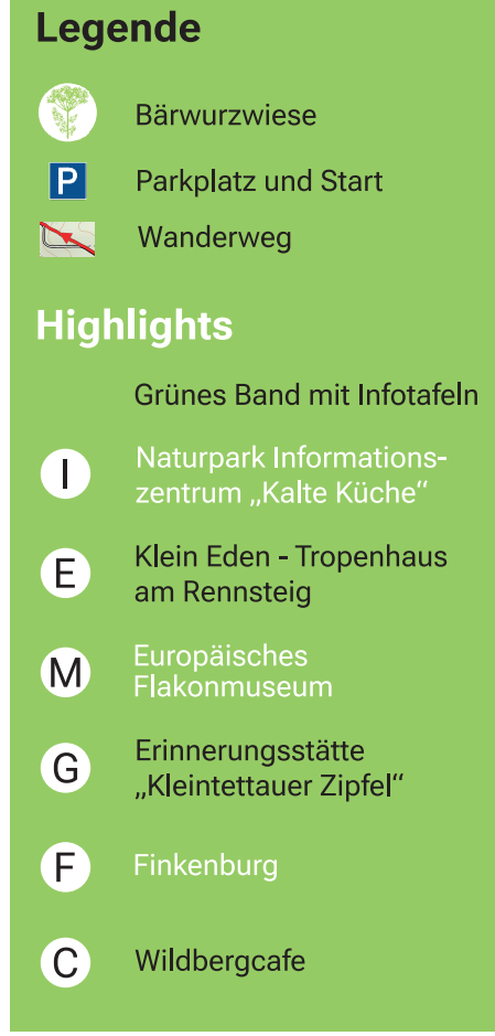
Schleifenwiesen im Grünen Band